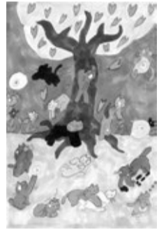
昨年度グランプリ作品

◇募集期間…5月10日(水)まで◇桜を描いたはがきサイズの作品を募集。グランプリ受賞作品は、次年度さくらウィークのプレゼントデザインに起用します。応募作品は5月27日(土)～7月3日(月)まで駒込図書館で展示◇小学生以上④作品を「〒170-0003 駒込2-2-2 駒込図書館」へ郵送か持参。詳細は問い合わせください。 問当館 ☎3940-5751