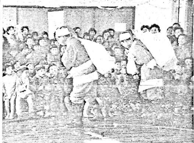
区長のサンタが区内保育園を訪問

都内の二ヶタ電話局番は、二月七日より一斉に二ヶタ局番の末尾に「一」をつけた三ヶタ局番にかわります。 (例) (97)→(971) (95)→(951)