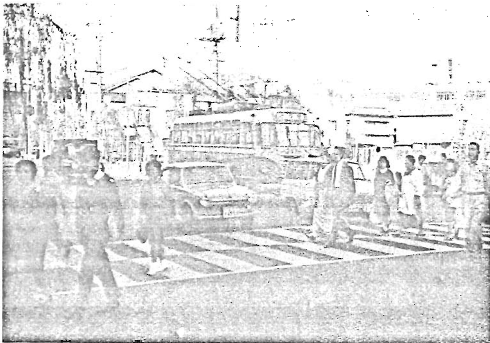
☆急ぐときでも 横断は横断歩道で☆

10月21日から30日までの10日間、「秋の全国交通安全運動」が行なわれます。これは春と秋の年2回、毎年行なっているものです。この運動期間中は交通のおまわりさんが、一生けんめいやってくださるため、交通違反をする歩行者もドライバーもほとんどみかけませんが、この期間をすぎるとまたもとのとおり。ちよつと情ないことです。