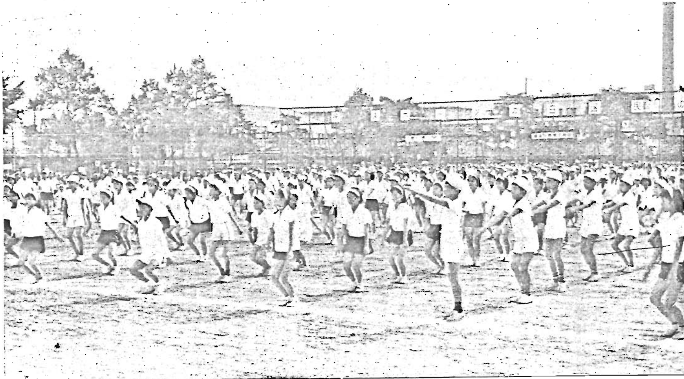
「スポーツの日」 区民のつどい

10月の第1土曜日は「スポーツの日」。5日午後1時から豊島区・区教委・区体育協会の共催で、第2回スポーツのつどいが区営総合体育場で開かれました。区内小・中学校児童生徒、豊島区民謡連盟および町会