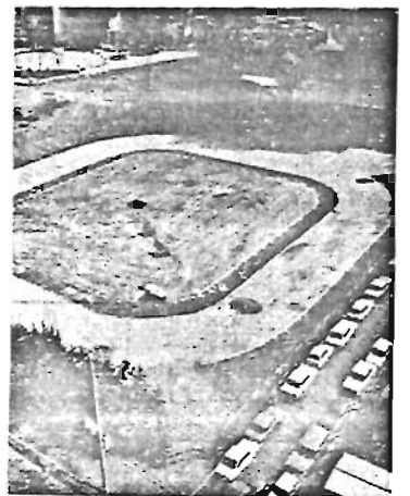
池袋西口にローラースケート場