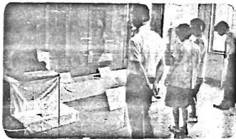
寺宝展、ここでしか見られません

区民センター五階の史料展示室で11月30日まで、西栗町四丁目正法院の寺宝が展示されています。