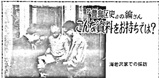
海老沢家での採訪