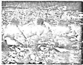
大好群の区民農園

区では、昨年4月に区民農園を開設しましたところ、皆さん大変ご好評をいただきました。そこで、本年も「土に親しむ機会」が少しでもあればと、区民の方を対象にご利用いただくことになりました。 ◇所在地：練馬区向山2丁目9番(西武池袋線中村橋駅下車、徒歩約10分) ◇利用面積：1区画約15平方メートル