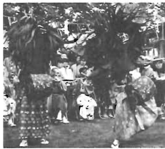
練習の成果を 5月13日に行なわれた祭礼で

郷土芸能はぼくらの手で引 き継いでいく。区立真和中 学校に、長崎神社に伝わる獅 子舞を守り育てていくという クラブがある。元祿のころ から伝承されてきたといわれ る長崎獅子舞は、区内唯一の 郷土芸能として毎年5月第2 日曜日に、保存継承をしてい る地元獅子連とこの獅子舞ク