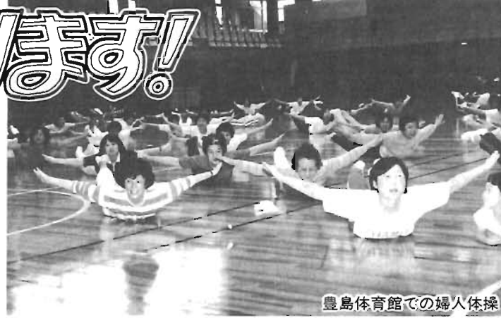
豊島体育館での婦人体操

節目年齢健康診査スタート 40・45・50・55・60歳の方を対象に 6月1日～7月31日