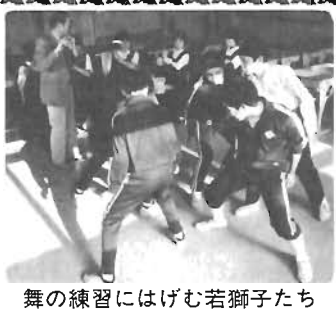
舞の練習にはげむ若獅子たち