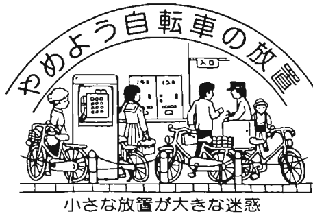
小さな放り場が大きな迷惑