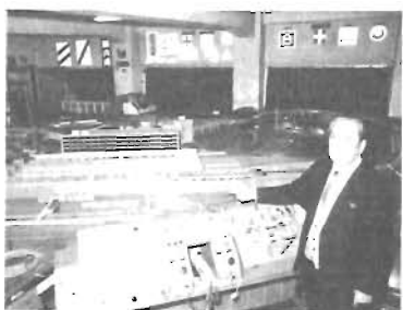
子供たちに喜ばれる鉄道模型のレイアウト

1階には、国産100型の運転台、ドア開閉装置、車体下の整流器が実物そのままに設置されていて、実際に操作できるようにになっている。本来は当校の機関科生徒の実習のためのもの。