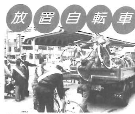
放置自転車 放置自転車対策に取り組んだ今年は、区内でもクリーン作戦を展開。