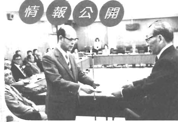
情報公開 情報公開懇話会の提言をうけて10月3日情報公開条例が制定された。