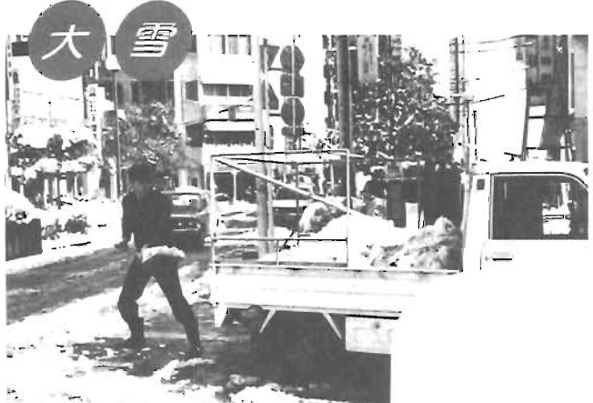
大雪 大雪のため路上での転倒者も多く除雪作業も徹夜で行われた。