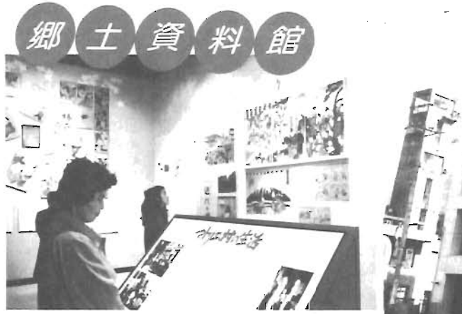
郷土資料館 区の歴史と文化への理解を深めるためにさまざまな展示が行われた。