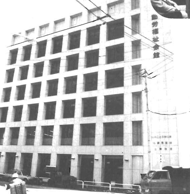
区制施行50周年記念事業として建設された勤労福祉会館は5月14日にオープンした。