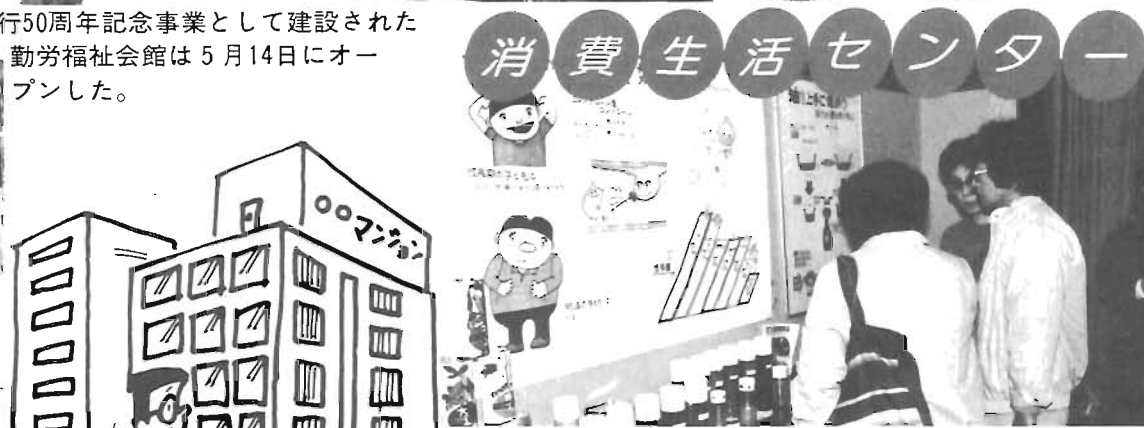
消費生活センター 消費生活行政の拠点として開設されたセンターは区民が積極的に活動し、交流を深める場でもある。