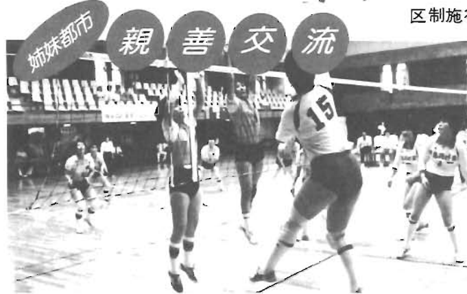
姉妹都市 親善交流 7月15日 豊島体育館で、秩父市との「家庭婦人バレーボール大会」が開かれ、熱戦が繰りひろげられた。