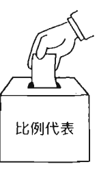
政党名を書いて投票