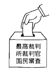
信任は空欄、不信任は×で投票