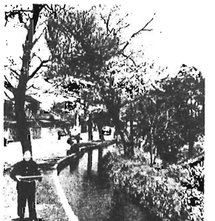
千川上水の桜(昭和25年ごろ)

今年は区制70周年(昭和7年10月1日施行)です。そこで昭和期の区内の暮らしやまちの風景を写真で紹介していきます。