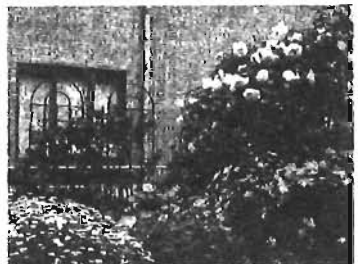
第4回コンクール 屋上・ベランダ部門区長賞

また、今後通路の幅員など一定の基準に合致する私道については、土地所有者から寄付を受けることで、新条例に基づき区