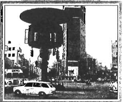
六ツ又ロータリー(昭和40年)