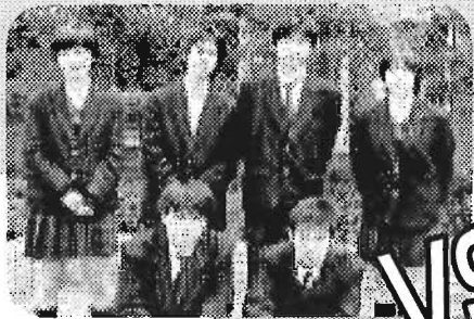
都立豊島 高等学校