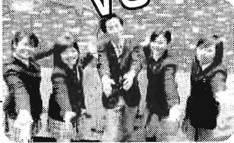
城西大学附属 城西高等学校