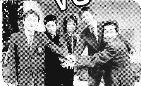
立教池袋 高等学校