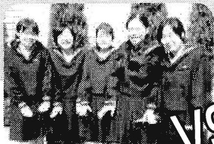
豊島岡女子学園 高等学校