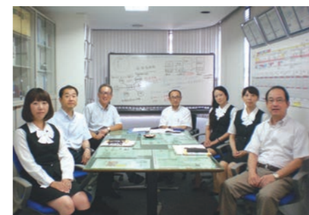
毎週行なっている会議の様子▶

そのため、当社では社長や管理職自らが、社員の働きやすい職場づくりのため情報を収集し、周知を行なっています。就業規則には「社員の誕生日休暇」を規定するなど、ワーク・ライフ・バランスを積極的に推進しています。