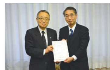
認定書授与式です▶

今後も地域に根ざした経営を展開する中で仕事と子育ての両立支援体制の整備に努めていきたいと思っております。