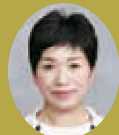
豊島区議会議員 竹下ひろみ