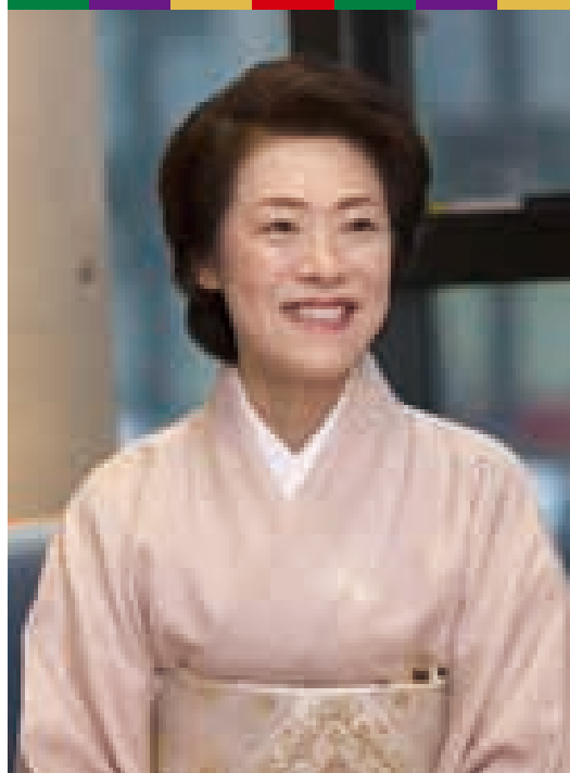
二代目 中村梅彌 日本舞踊中村流八代目家元。平成24年3月、先代家元で父の七代目中村芝翫の遺言により家元を継承。一般向けに歌舞伎舞踊体験の場を設けるなど広く日本舞踊の普及に努める。平成27年度日本芸術院賞受賞。豊島区国際アート・カルチャー都市懇話会委員。