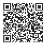
▲携帯電話 ▲スマートフォン

②郵送・持参で 登録用紙を区ホームページからダウンロードし、学習・スポーツ課へ提出してください。 ※活動に際し、保険に加入します。保険料は区が負担します。