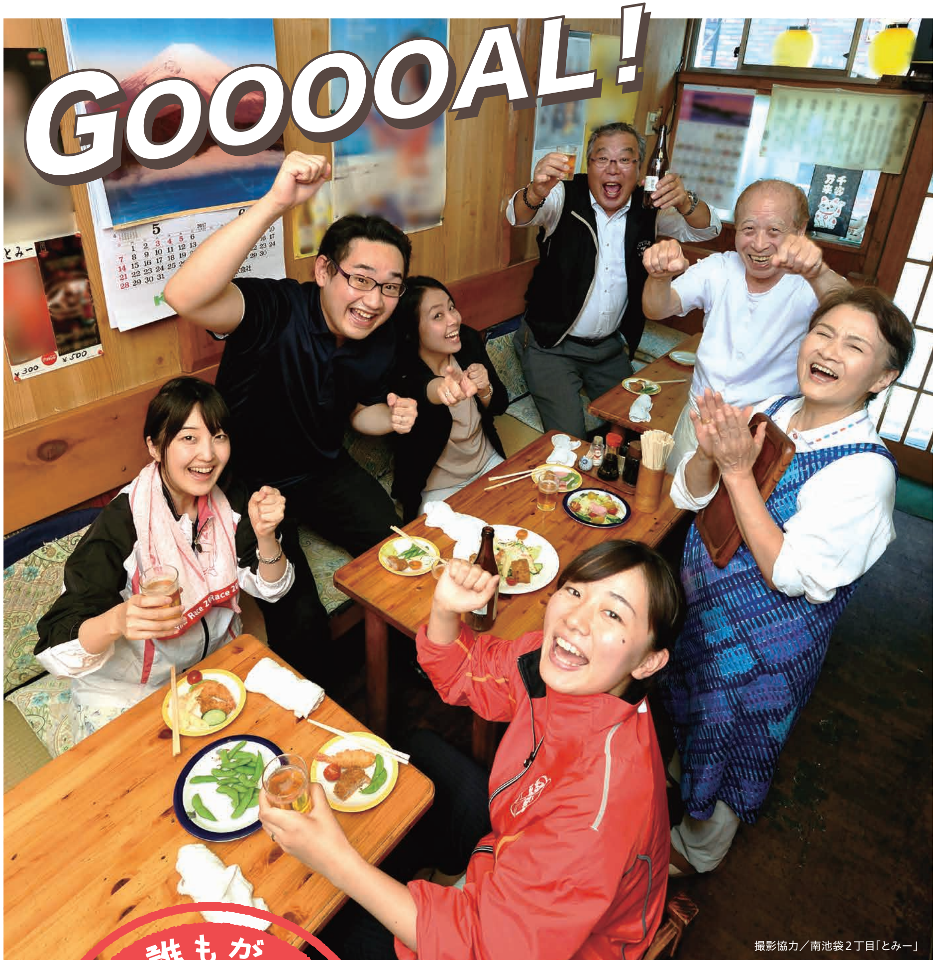
撮影協力/南池袋2丁目「とみー」