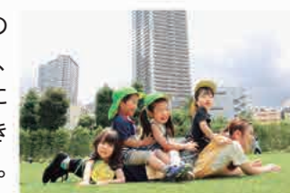
▲豊島区役所本庁舎をバックに晴れた日のお散歩(南池袋公園にて)

アットホームな雰囲気なので子どもたちがのびのびしています。また、園庭はなくても、近くに公園があるので、園児たちと一緒に体を動かせます!芝生で寝そべることもできるので、園児たちも気に入っているようです。