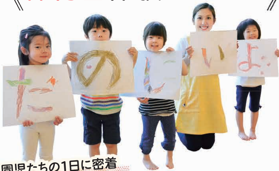
園児たちの1日に密着

豊島区は今年4月、待機児童ゼロを達成しました。受け入れ枠を増やすだけでなく、保育の質にもこだわり、日本一の保育を目指しています。保育園ってどんなところ?保育士さんはどんな仕事をしているの?そんな疑問に迫るべく、元気な子どもたちと日々奮闘する慌ただしい保育現場に広報課職員が1日保育体験をしてきました!