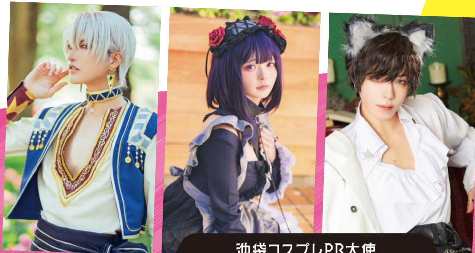
池袋コスプレPR大使